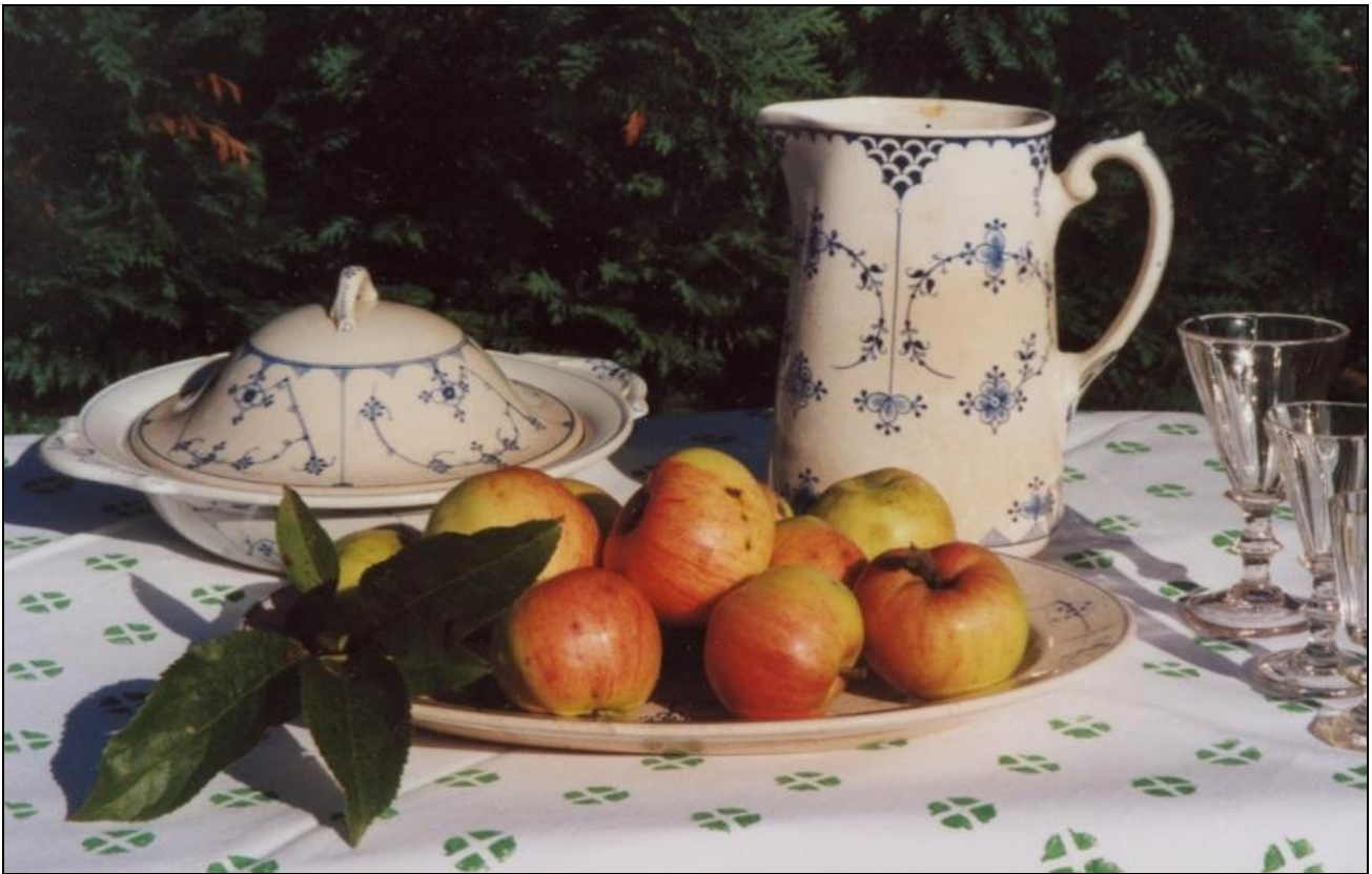
Sommerminder og søde Smidstrupæbler!