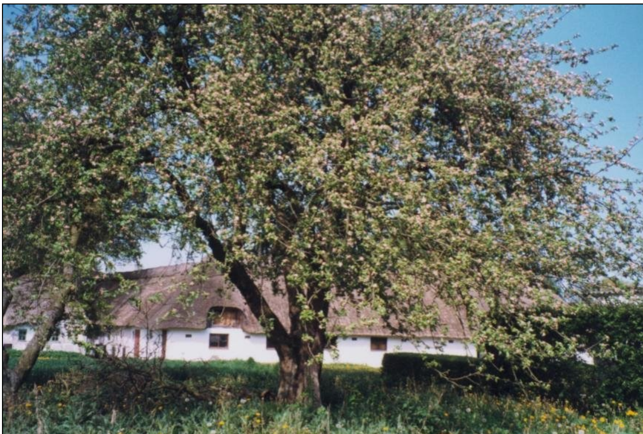
Ingen vår som en maj i vort land. Gerskov-æbletræ i blomst på Gerskov Bygade 20.

Et stort Gerskovæbletræ findes i dag på Gerskov Bygade 20. Et andet kæmpetræ findes i haven ved Hessum gamle skole, Hessum Bygade 38.