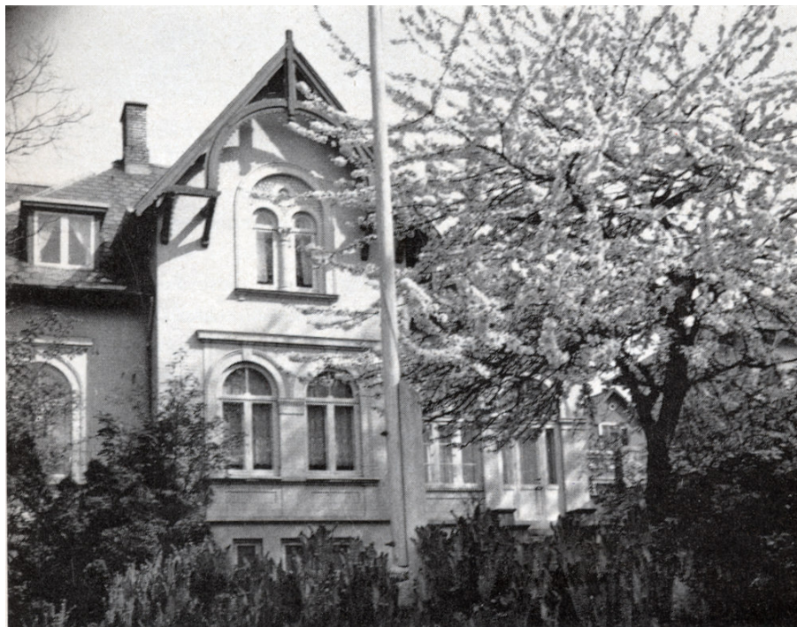
Det fynske Musikkonservatorium i nye lokaler fra 1954, Kronprinsensgade 19. Foto 1954

I virkeligheden har han i det praktiske liv arbejdet med sine projekter på samme måde som med værkerne i koncertsalen – Lad der være underforstået vittighed i hans egne ord om, at konservatoriet skylder ham meget – omkostningerne har været belønningerne.