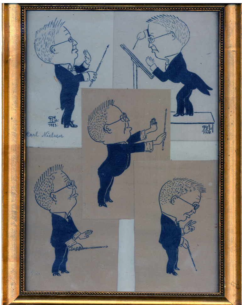
Carl Nielsen på podiet karrikatur af PEJ i 1918 og 1923.