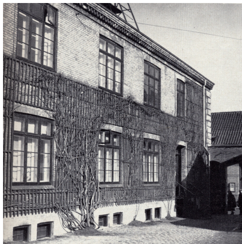
Det fynske Musikkonservatorium i Gl. Borgmestergård, Albanigade 5. Foto ca 1929