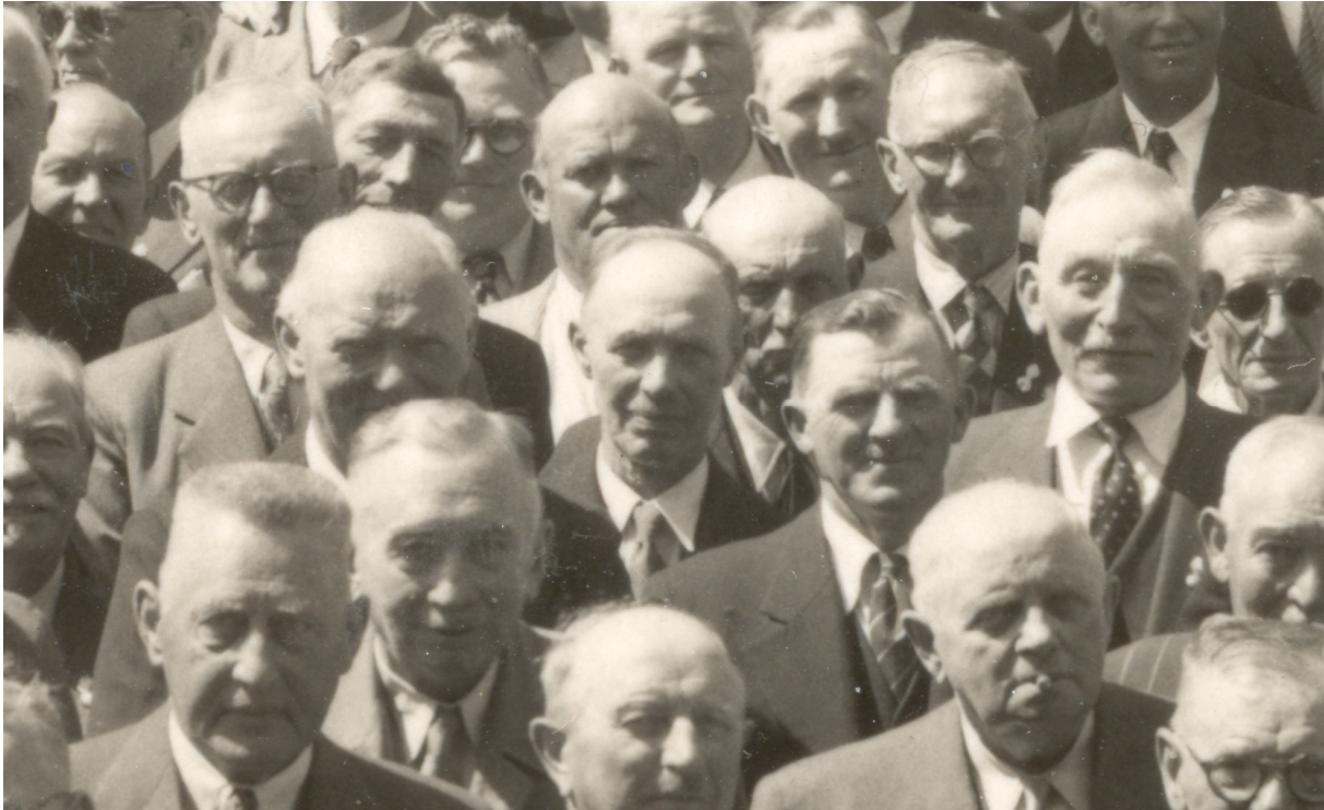
Christian "tømrer" lige i centrum