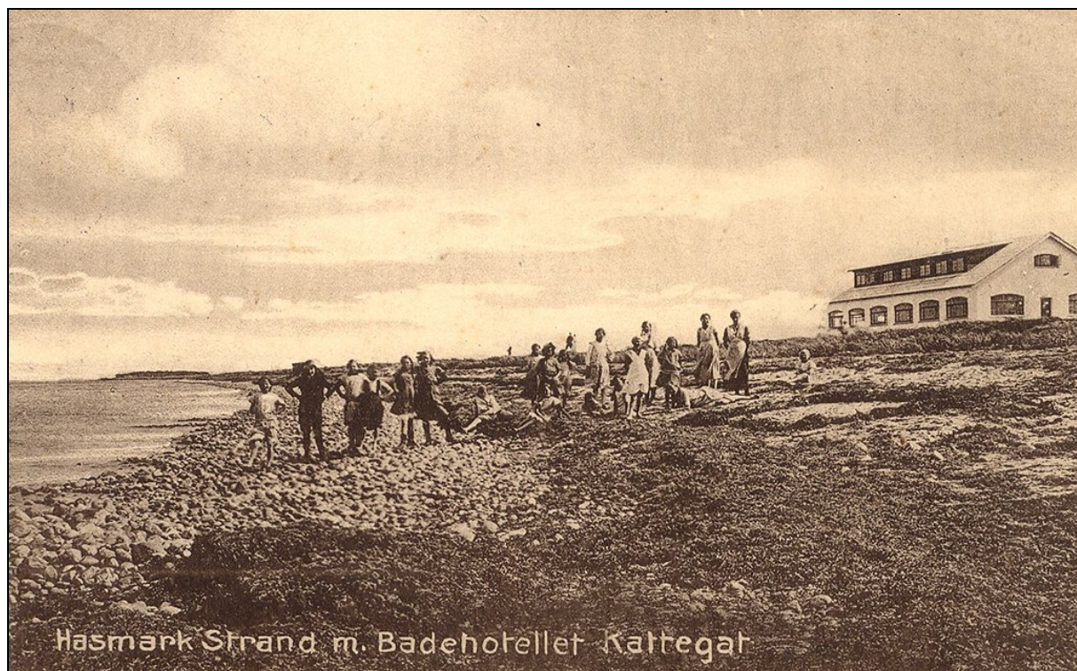
2 postkort afsendt fra Hotel Kattegat i september 1916.