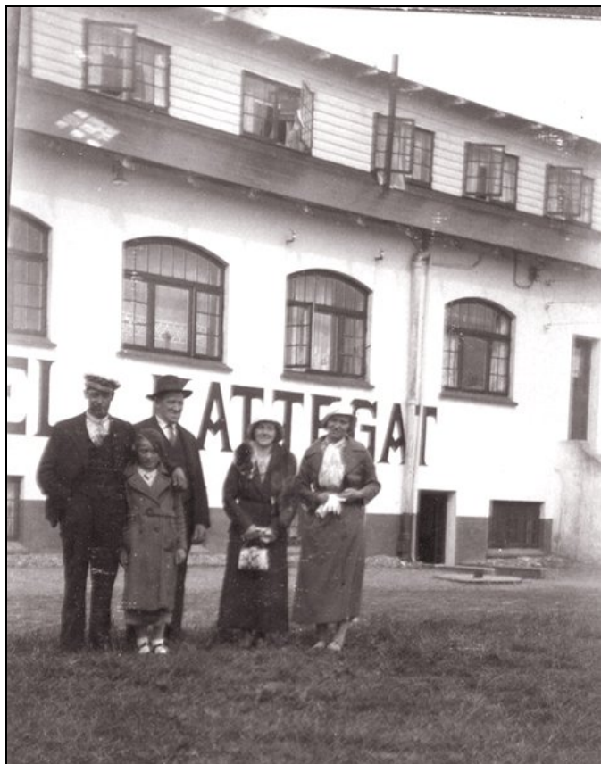
Gæster ved Hotel Kattegat

Dagen igennem var gæsterne blevet godt beværtet.