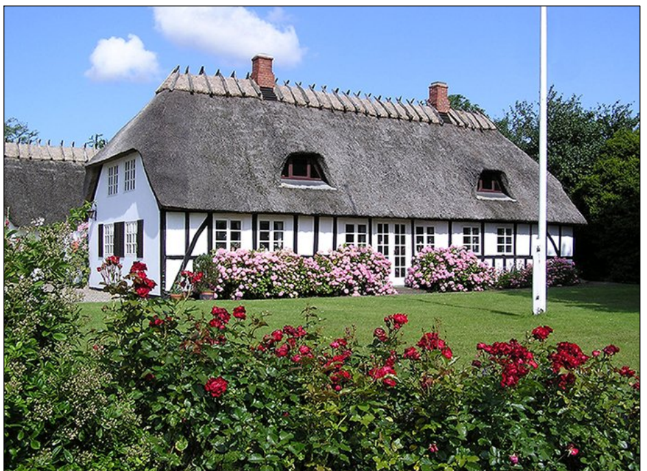
Den tidligere købmandsbutik i Egense på adressen Egensevej 74. Foto juli 2004 af Margit Egdal.

Frk. Nielsen døde kun 49 år gammel i 1927.