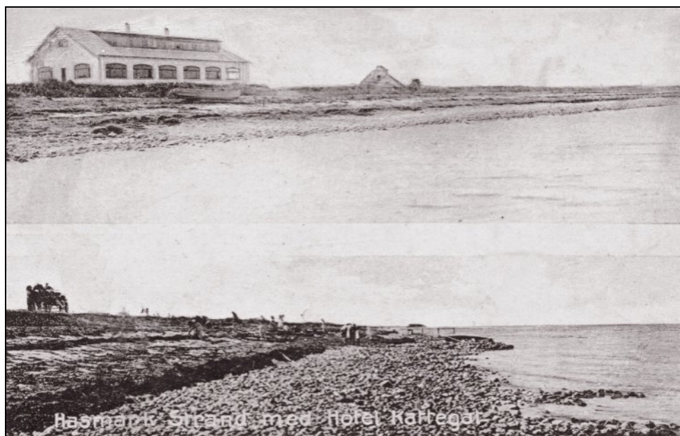
Hotel Kattegat ved Hasmark Strand.