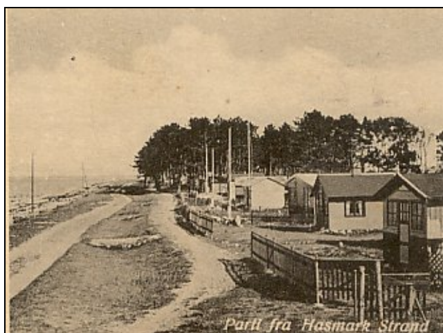
Partier fra Hasmark Strand. Efter postkort sendt 5. aug. 1938.