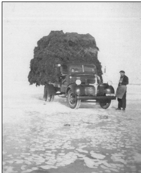
Tangkørsel ved Odense Fjord

Jeg skal ikke gøre mig klog paa det, men siger man ikke, at det var forgiftning? I hvert fald forsvandt tangen i 1921, og saa kom besværet for alvor, og havet kom til at koste os mange penge.