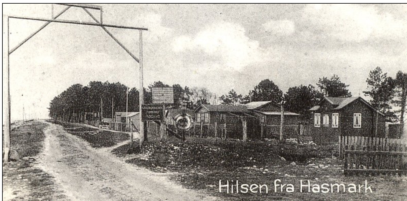
Parti fra Hasmark Strand. Efter postkort afsendt 6. aug. 1935. På det sorte skilt med lys skrift synes der at stå: Uvedkommende forbydes adgang.

Så vidt avisen i 1956. Det var i øvrigt året efter, der kom en ny retskrivnings-ordbog, hvorefter man ikke mere skulle skrive aa - men å.