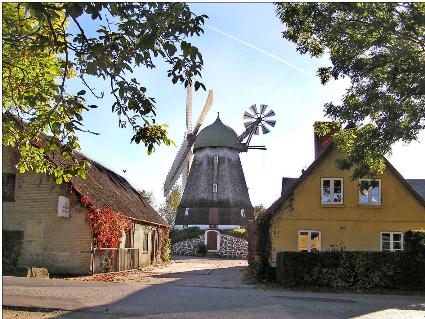
Møllefotos Margit Egdal ©