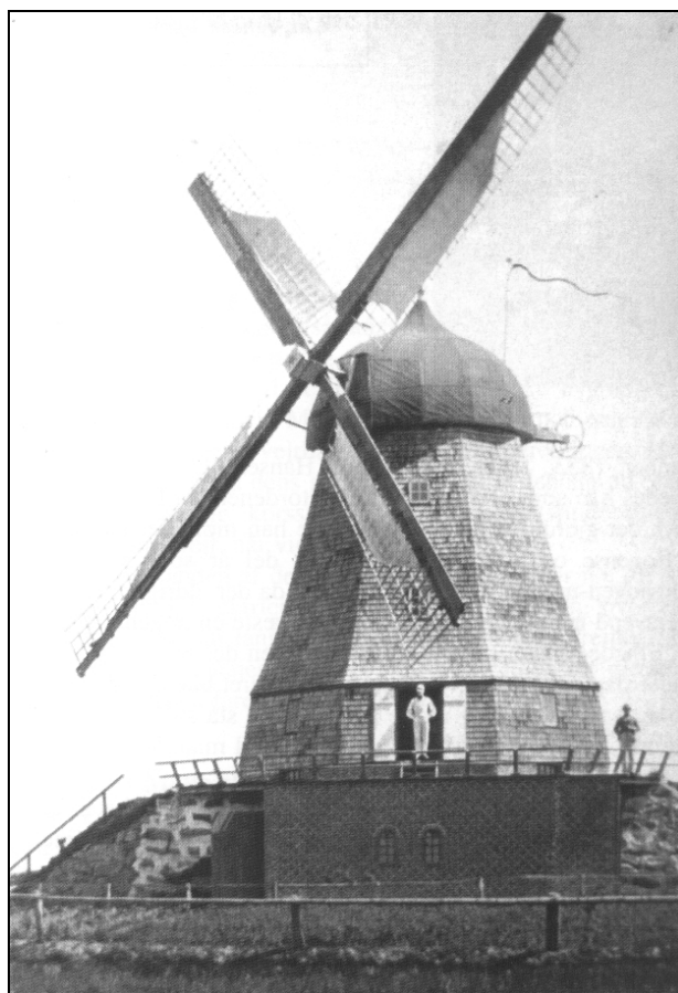
Den første Uggerslev Mølle bygget i 1880. Nedbrændt 1889.