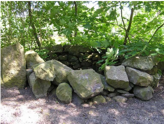
Den gamle brønd på Kørup.