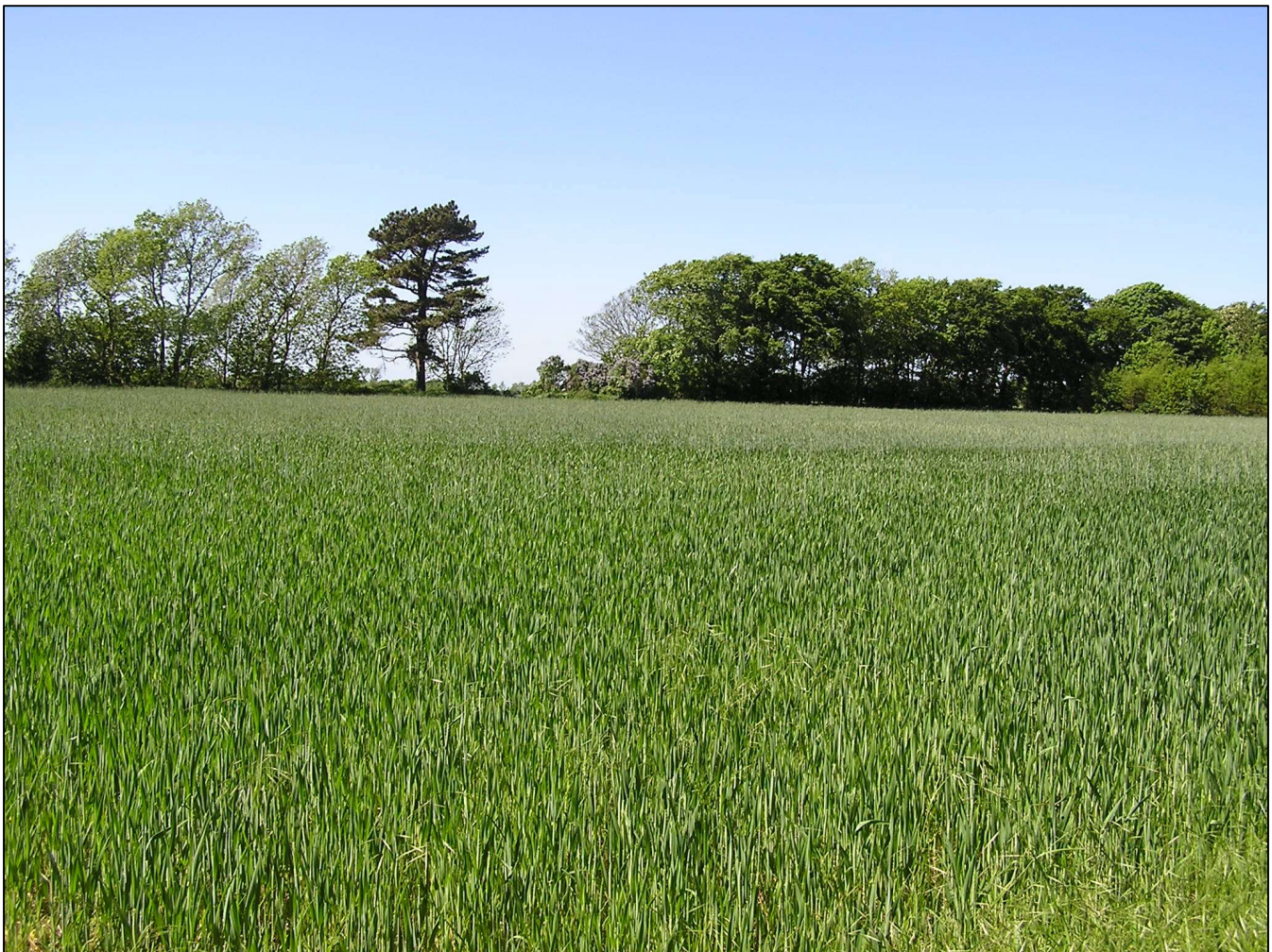
Kirkemarken hvor den prægtige Kørup Kirke lå. Det gamle fyrretræ fortælles at have stået ved kirken. Der var dog ingen kirkegård i Kørup, den lå i Agernæs. Fotos Margit Egdal 29. maj 2005.