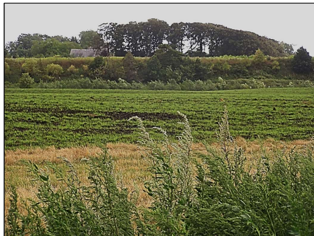
Fjorden, som man skulle over for at komme i kirke, er i dag tørlagt. Her ser vi hen over marken på den gamle fjordbund til den markante havskrænt. Bagerst skimtes Kørups avlsbygninger, og bag tærne lå Kørup Kirke.

Husmandfolk, der ikke havde vogn, kunne ikke forcere stranden, når vandet stod op.