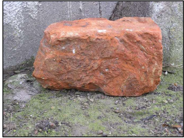
Sten fra Kørup Kirke.

Endnu sidst i 1800-tallet stod anselige rester af murværket endnu. Stenene fra kirken dukker stadig op på markerne omkring kirken. Mange blev brugt som vejfyld.