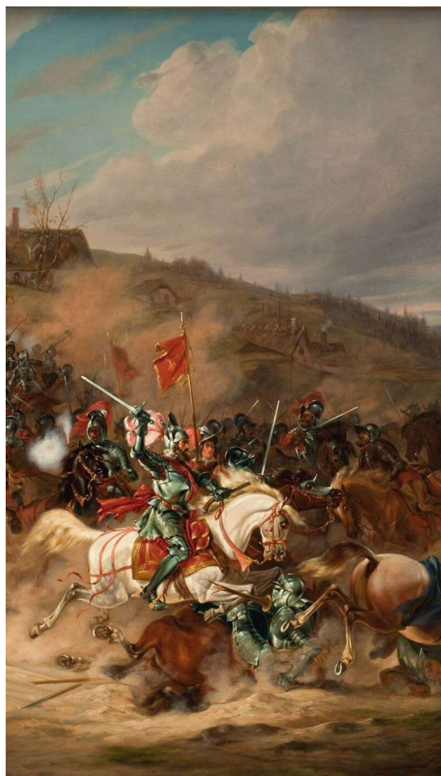
Udsnit af Christian Holms billede "Daniel Rantzau erobrer Tureby Bro i Skåne under Syvårskrigen 1563-70.