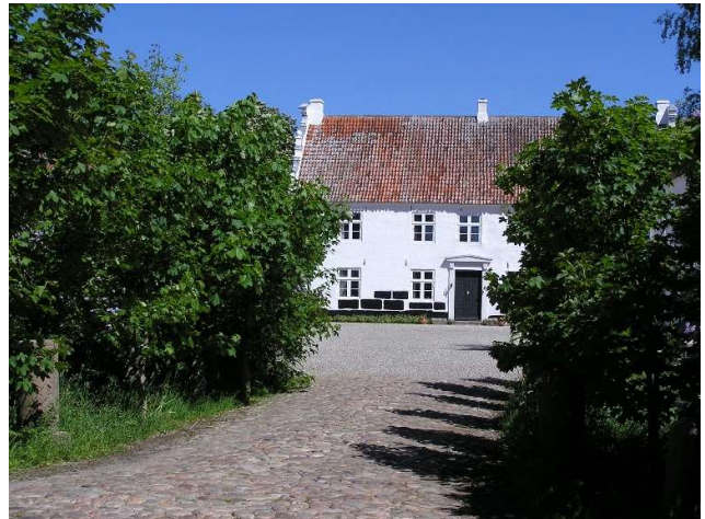
Kørups hovedbygning fra 1582.