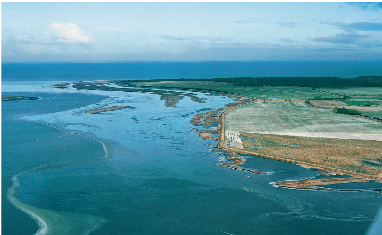
Agernæs Fælled på østkysten af Nærrå Strand er også inddæmnet, men foran dæmningen ligger der en broget mosaik af holme på det lave vand. Her trives ænder og vadefugle stadig i stor stil. Foto: Fyns amt, årstal ukendt.