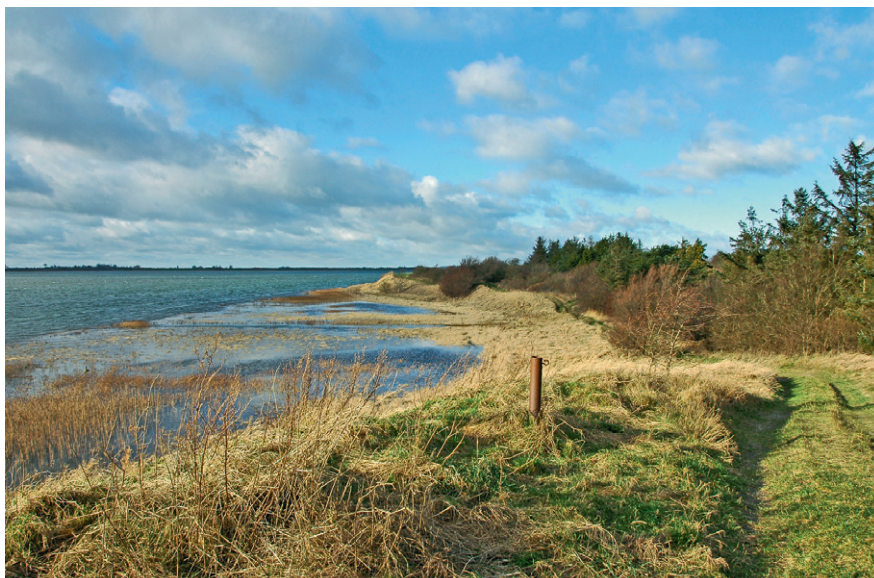
Den lave Storeø i bunden af Nærrå Strand oversvømmes delvis ved ekstreme vandstande i fjorden. Besynderligt nok er der plantet en mindre granplantage på øen, hvor der tidligere har været strandenge og overdrev.