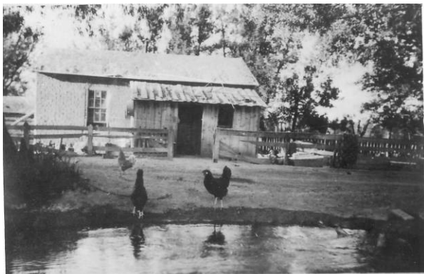
David og MM's første hjem i Elsinore bygget ved bredden af Elsinore kanalen