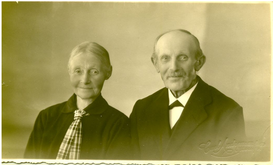
Sølvbryllup. ca 1909