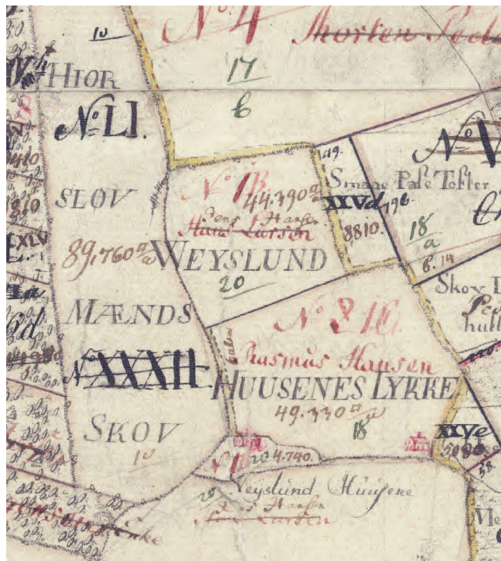
Matrikelkort 1809-1862 med de oprindelige betegnelser

Ejendommen var et lille næsten jordløst hus beliggende i skovbrynet til Ørritslevskov som fra gammel tid blev kaldt Weyslund . Rundt om skoven i brynet lå der omkring 30 små landarbejderboliger hvor de fleste hørte under Østrupgård . Men dette her var et fæstehus under Ørritslevgård hvor der tidligere havde hørt en lille mark til på 1-2 tdr land. I dag hedder vejen der fører "om i kroen" Agerlandsvej.