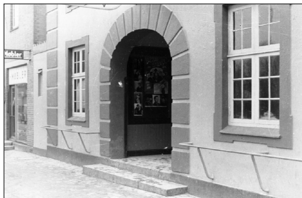
Indgangen til biografen i Bredgade

Man kunne enten få karbad eller brusebad – men det kostede jo lidt. Bag ved elværket, altså over imod biografen, fandtes der to store bassiner, som kølevandet fra maskinerne løb ud i, og det kunne godt give de to herrer, som passede værket, grå hår, for da der ikke var så mange penge mellem folk, ja, så ville de store drenge hellere i biografen end i bad, men i bad kom de, for de tog badebukserne på og kravlede over hegnet til bassinerne og sprang i det meget varme vand. Det var kun dem, der kunne svømme, der gjorde dette, for der var 3 m dybt og ca. 10 m langt og 4 m bredt.