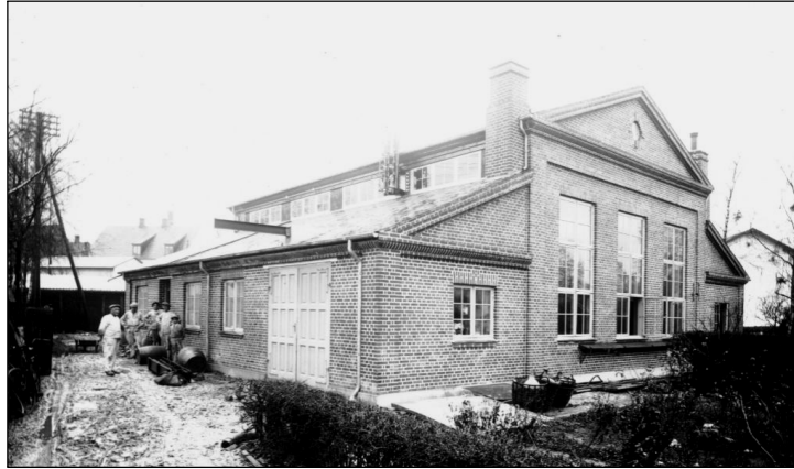
Det gamle elværk på Torvet