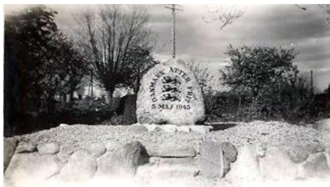
Mindestenen op ”den grønne banke”.

Enhver landsby havde et samlingssted, hvor de unge mennesker søgte hen efter fyraften til fælles glæde og hvad det mere kunne blive til. Her i Gerskov har man ”Den grønne banke” . Der er nu ikke meget banke dér; men det hedder den altså!