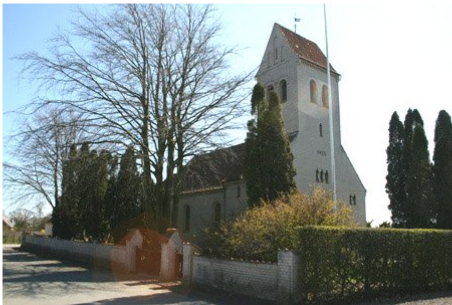
Gerskov kirke fra 1925