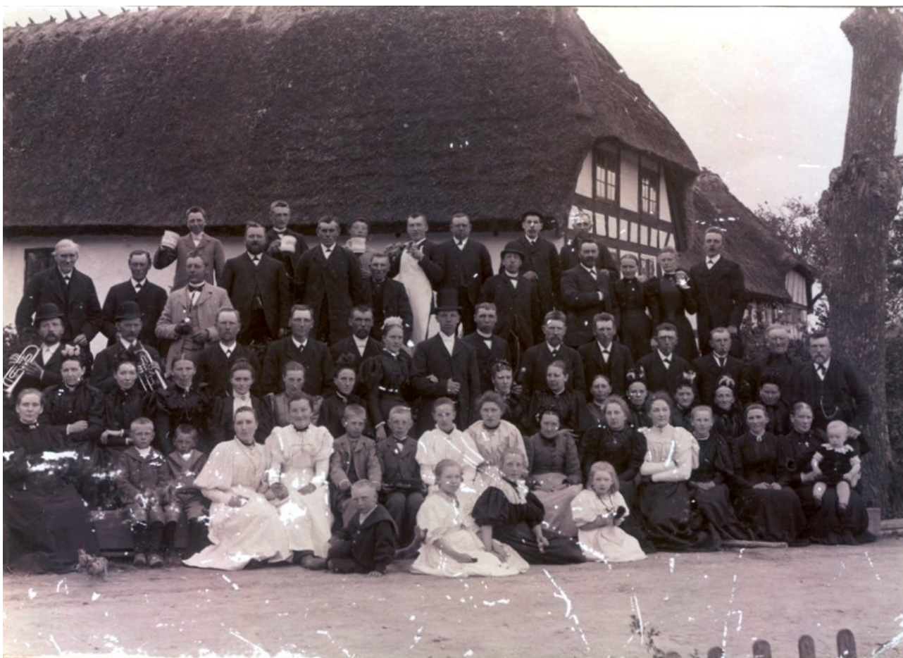
Gerskov’erne til bryllup hos Marius Rasmussen overfor den grønne banke (se navnene side 5).

Fra rigtig gammel tid har Gerskov haft et byhorn som der blev værnet om for det skulle kalde bonden til hovarbejde og til møder ved bystævnet, når landsbyens problemer skulle løses under ledelse af oldermanden. Det findes ikke mere for det gik til da sognefogedgården brændte ved lynnedslag i 1918 – dengang var det et kohorn med mundstykke - og det har sikkert kunne give nogle gevaldige