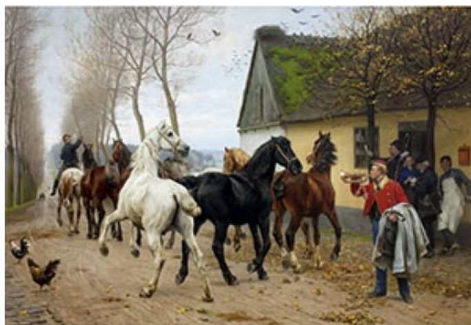
”Et kobbet heste udenfor Lindenberg Kro”. Maleri af Otto Backe i 1878

vræl fra sig. Selvfølgelig skulle der anskaffes et andet, og man drog til Odense for at købe horn. Nu var bønderne dengang både påpasselig og fornuftig i økonomiske anliggender, og det var påfaldende at det horn de valgte havde været brugt før. Det var et posthorn, som lignede nøjagtigt det som postkusken trutter i på det meget kendte maleri ”Et kobbet heste udenfor Lindenberg Kro”. De flottede sig dog så meget, at de fik indgraveret ”Gerskov Bylav” på tragten.