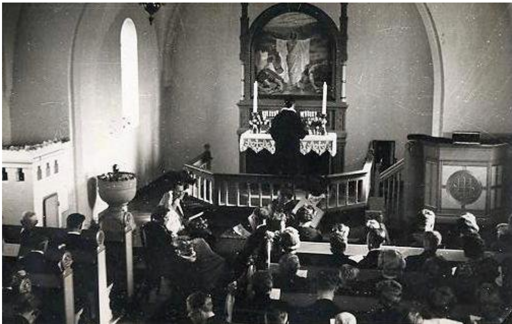
Gerskov Kirke med altertavle af Ellen Hoffmann-Bang. 1943

Kirke, skole, sognerådsformand, lillebil, frisør, skomager, sygeplejerske, smed, vognmand, tømrer, bådebygger, Brugsforening, ostehandel og frysehus. Sikke tider – og deres koner fik børn og børnene trivedes og voksede og legede sammen. Der var masser at bestille og alle der ville kunne få arbejde. Men tiderne forandrede sig, og pludselig skete der en masse, som ikke var godt for Gerskov og dens beboere.