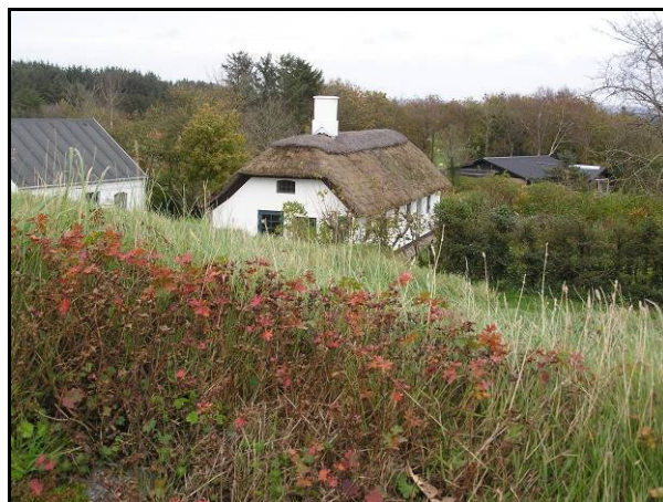
Ved Vennebjerg Kirke.