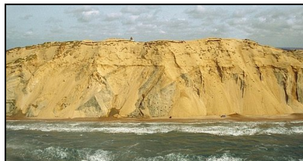
Rubjerg Knude.