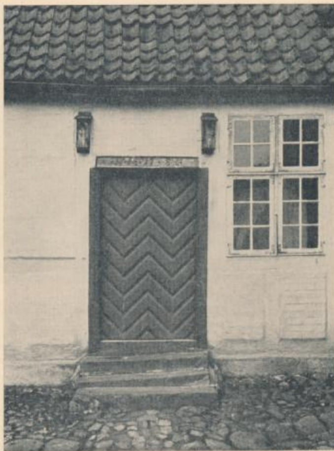
Gammel Dør i en af Fløjene.