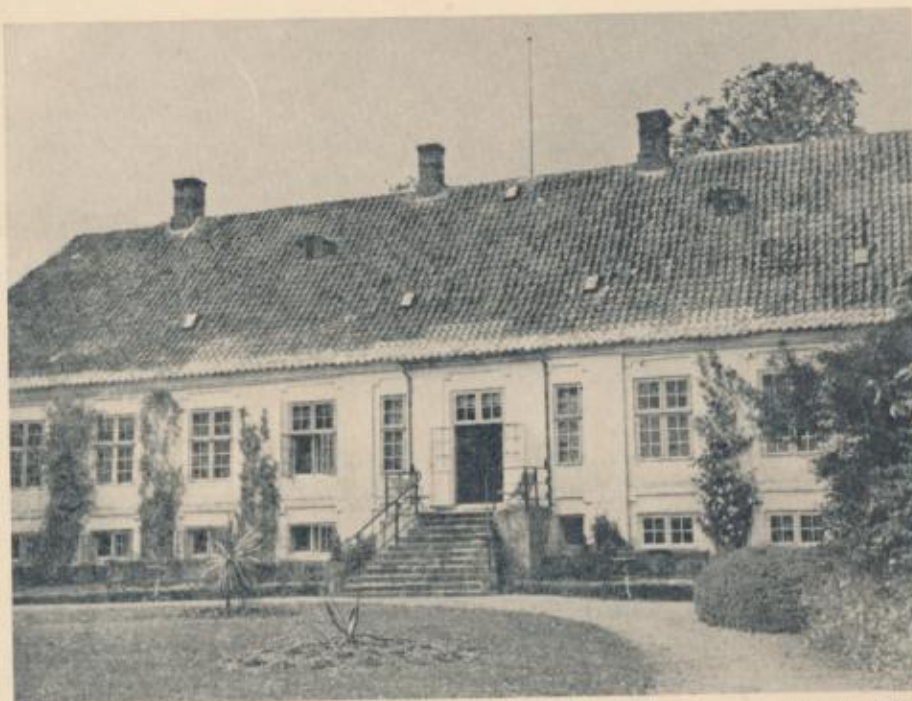
Hofmanskøbe, set fra Øst.