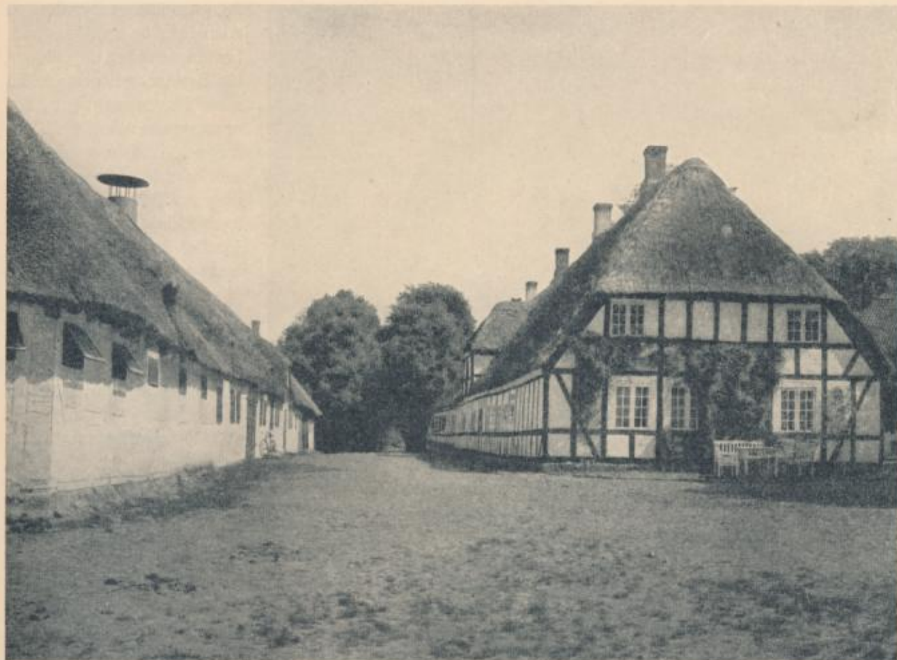
Parti af Ladegaarden med Bindingsværksfløjen fra 1784.