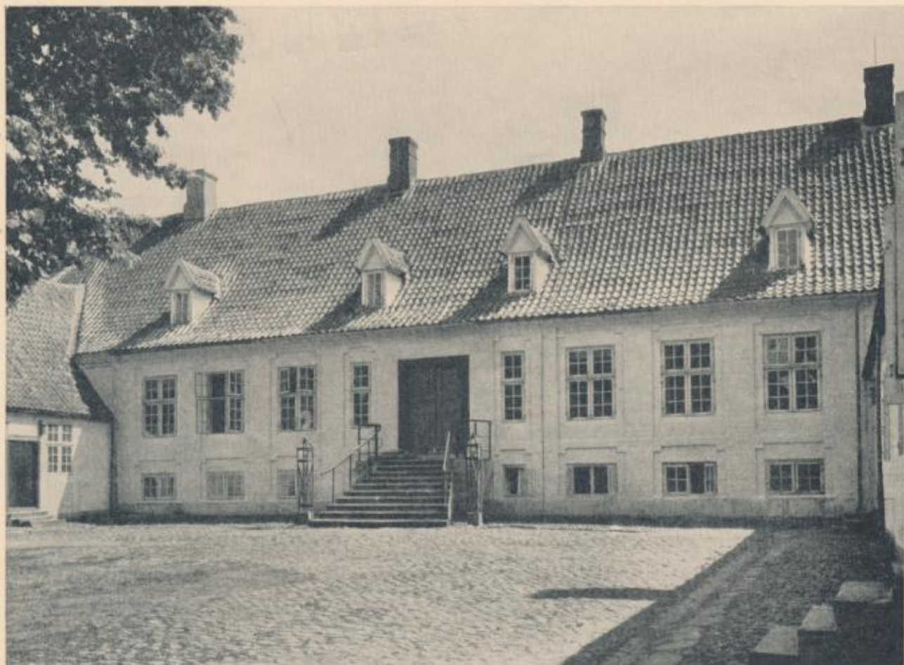
Hofmanskave, Hovedbygningen, set fra Vest.