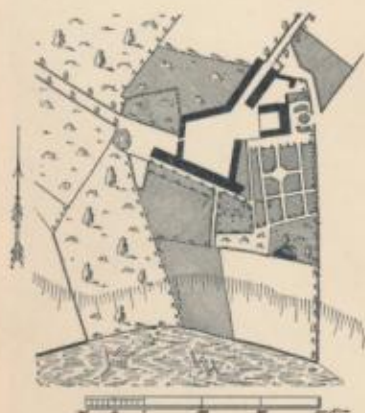
Beliggenhedsplan ca. 1800.

Hosstaaende er gengivet et Grundrids af Gaardens Bygninger, tegnet i 1783. I Henhold til en samtidigt nedskrevet nøjagtig Beskrivelse af Bygningerne maa Grundridset være rigtigt i Detaillerne, medens Forholdene i