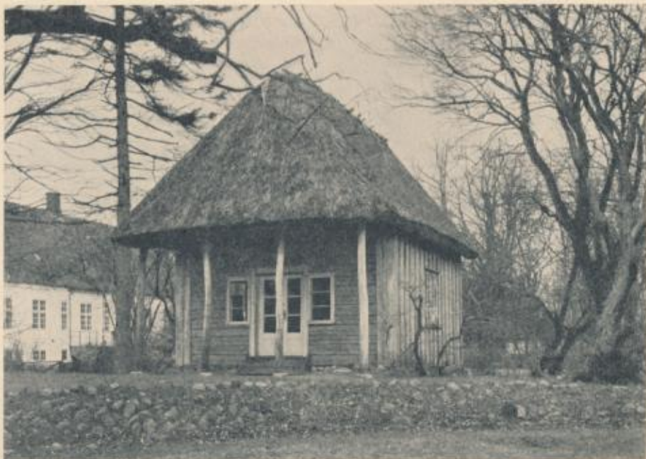
»Det norske Hus, Pavillon i Haven.