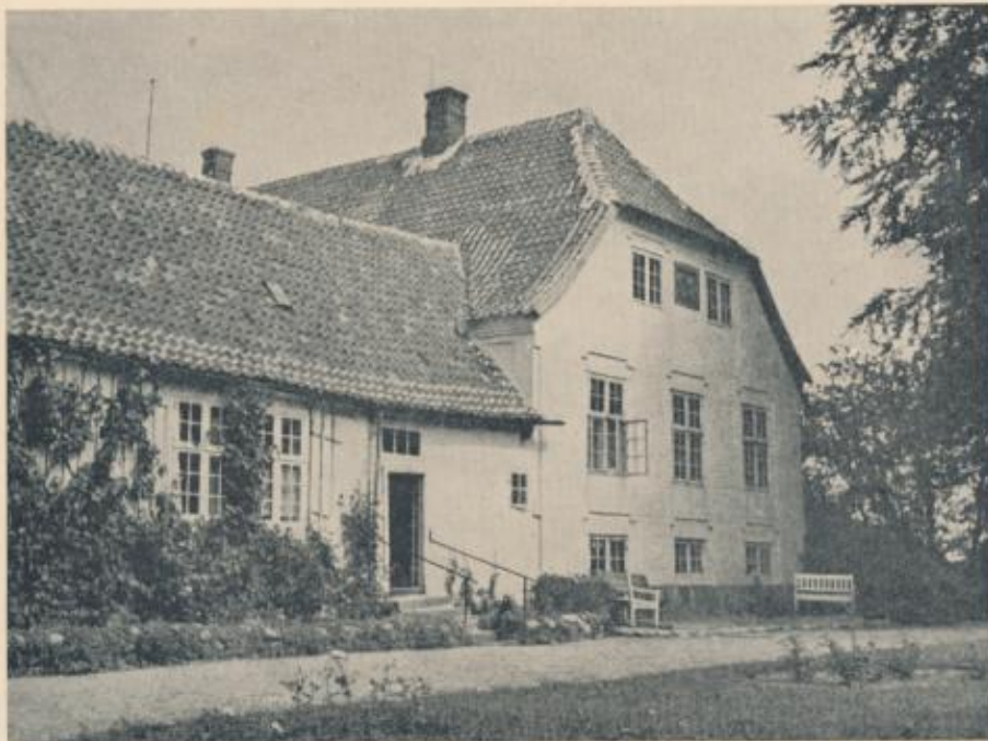
Hovedbygning og en af Fløjene, set fra Sydvest.