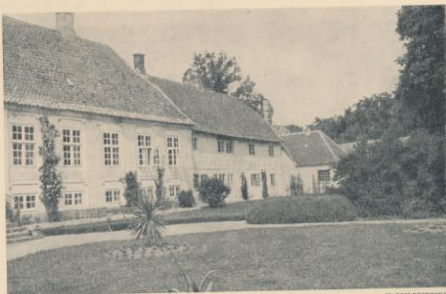
Hovedbygningen og en af Fløjene, set fra Sydøst.