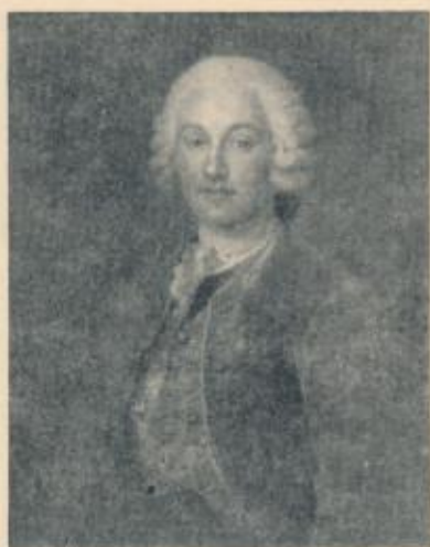
Tycho de Hofman († 1754). Maleri paa Hofmansgave.