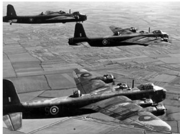
Til venstre Stirling IV. Til højre Stirling med kanontårne på ryggen og næsen.