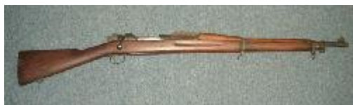
En 8-18 RIA riffel

Børge var med i modstandsbevægelsen og det stammede fra en af de engelske flyveres nedkastninger.