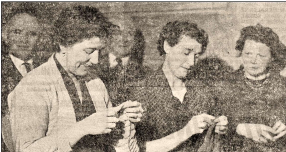
Selv om næsten alle kvinderne strikker, mens der læses op, går de sjældent glip af noget. Smilene skyldes sikkert kun fotografens tilstedeværelse.