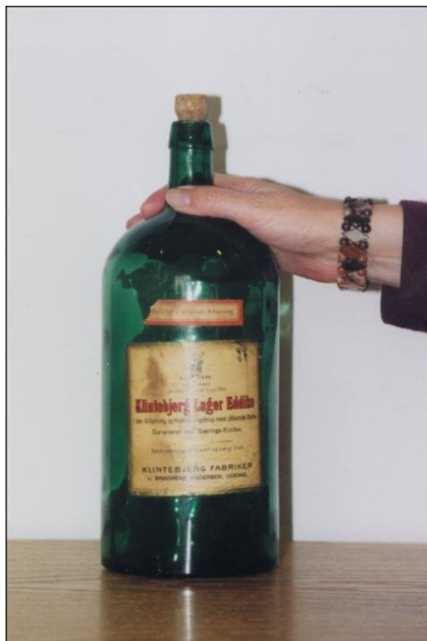
En flaske eddike fra det lokale eddikebryggeri i Klintebjerg

Når "Odensedamperen" (DFDS rutebåd m.s Odense) så kom, blev flåden fortøjet ved siden af skibet. Mens det langsomt sejlede ud gennem fjorden, blev tønderne hejst om bord. Var der mange tønder, kunne skibet nå langt ud i fjorden, somme tider helt til enden af den "lange dæmning" ved Vigelsø. Ved kraftig blæst fra vest kunne det være et drøjt arbejde at stage flåden tilbage til Klintebjerg. Efterhånden kom der lastbiler og kørte eddiken til Odense, så slap man for det strenge arbejde i al slags vejr.