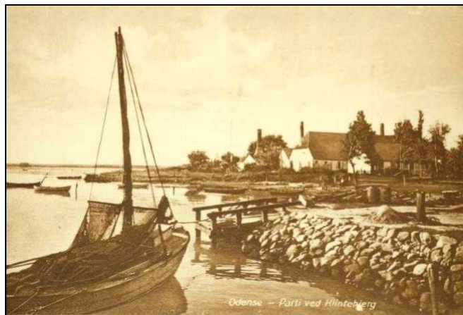
Partier fra Klintebjerg Eddikebryggeri.