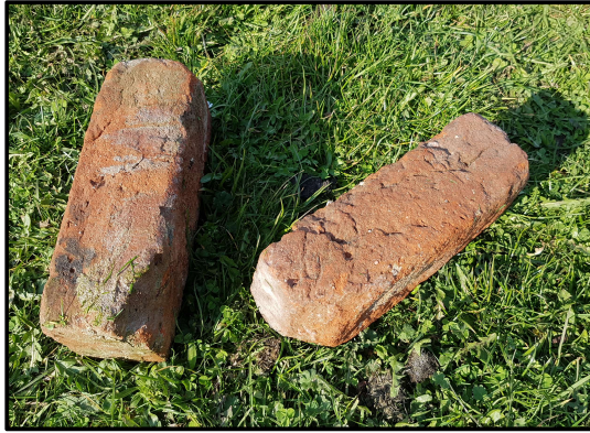
På Roerslev Korsgård fandtes en del sten fra Kørup Kirke. Et par stykker blev givet til Otterup Museum.