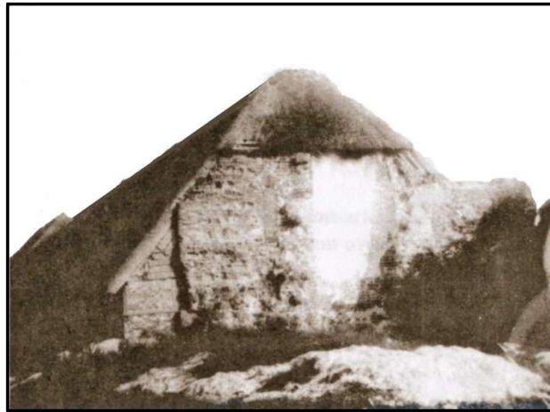
Kirken var gavt i tærskeladen.

Nedbrydelsen lod som nævnt ikke vente længe på sig. En mængde af granitkvadrene blev brugt ved anlægget af en dæmning mellem Einsidelsborg og Kørup. Endnu kan man på egnen se de svære granitblokke, der engang var en del af den anselige kirke.