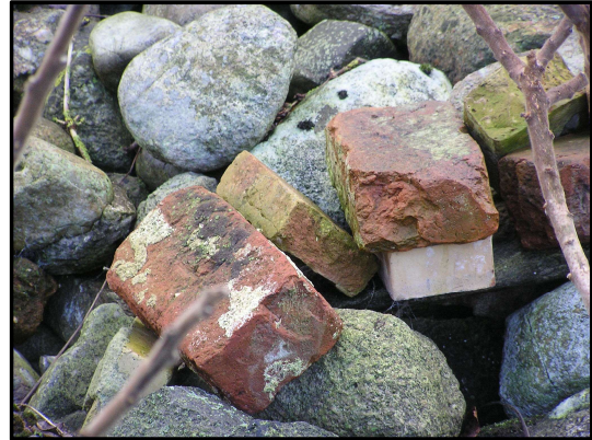
I en stenstak i Agernæs ses sten fra Kørup Kirke.