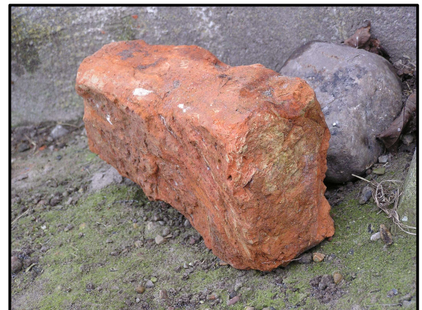
Sten fra Kørup Kirke.