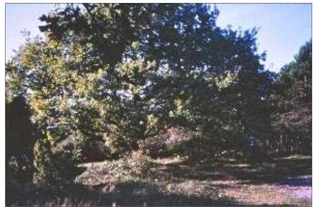
Parti fra Storskoven.

Mens vi er ude ved Kattegat, bør vi se på skoven langs kysten. Den er meget ejendommelig. Træerne er meget forkrøblede. Man ser ege, det er hovedparten, elme, fuglekirsebær og andre. Alle fortæller om en gigantisk kamp med nord- og vestenvind. De har måttet bøje sig, de yderste naturligvis dybest. Ser man det udefra, er det som et skrånende tag. Først ca. 80 meter inde i skoven når træerne deres fulde udvikling, skærmede af de hårdt trængte, men enestående udholdende forposter.