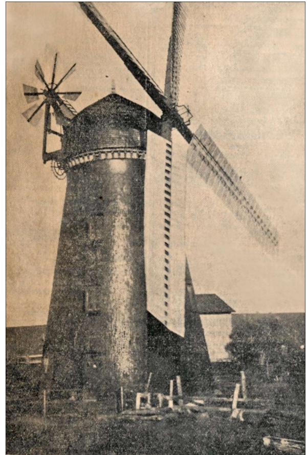
Slusemøllen, foto fra artiklen 1936.

Kørup Slot har en lang og rig historie. Vi ser på voldgravene og de ejendommelige bygninger fra Christian den fjerdes tid, kirken med de skumle kældre, der vel også har været under det rigtig gamle Kørup, og standser et lille stykke fra den gamle hovedbygning på det sted, hvor Kørup kirke lå; den var så stor som St. Knuds Kirke til alteret og måske den herligste udi Fyn. Den hed Helligtrefoldighedskirken. Men allerede 1781 var den tjenlig til nedbrydning, og de gamle putbusker, der havde fundet hvile under den, blev flyttet til Rügen. Et mærkeligt kapitel i dansk kirkehistorie er historien om de to forsvundne kirker (i Agernæs og Kørup).