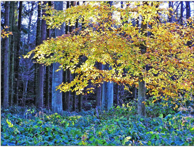
Bederslev Daleskov er vokset godt til, men der er stadig tydelige spor efter højryggede agre i skovbunden.

Bederslev Dalskov er en ny skov. Endnu ca. 1860 var her overdrev, uopdyrket jord med græs. Hver gård havde sit stykke; men da grundene gik over til selveje, tog den daværende lensgreve det fra, og der blev så plantet skov. Jorden var og er mager, så det er nåletræer og birk, der er hovedbestand, men der er også pæne bøgebevoksninger, der er ca. 60 år gamle. Skoven, der er stærkt kuperet, frembyder stor afveksling og skønhed, og den huser en masse fuglearter, ligesom dens blomsterverden er interessant.