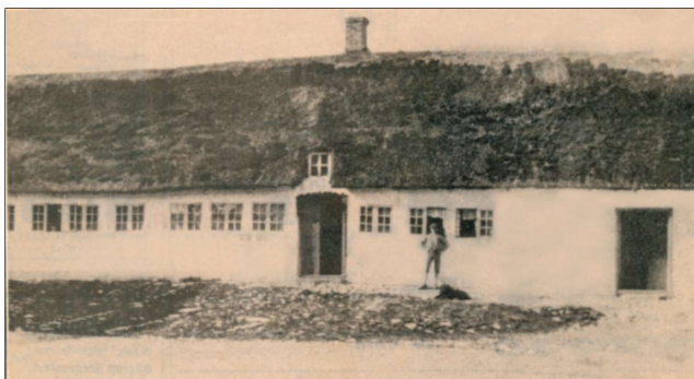
Den gamle Ellegård i Gyngstrup.

Gyngstrup er en skoleidyl. Det gamle kastanjetræ med et imponerende omfang dækker til dels den gamle skolebygning fra 1826, som endnu er i brug, og som danner fjerde længe i den hyggelige skolegård.