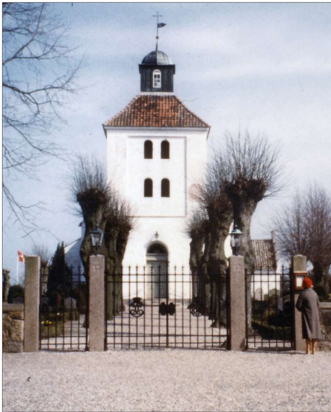
Krogsbølle Kirke.

Fra tårnet har man et herligt rundskue. Mod nord ser man ud over det dejlige Kattegat, til Endelave, til Samsø, skimter Refsnæs, og over Hindsholm mod øst lader man blikket glide ind ad Odens Fjord til Munkebo Bakke. Mod syd er Odense gemt; men en hilsen får vi fra Odinstårnet. Bakkerne ved Ravnebjerg ser man tydeligt. Skove og bakker ved Bederslev spærrer ellers af til den side. Mod vest åbner sig atter et herligt syn: Kørup, Næråstranden, Æbelø og bag denne Jyllands kyst. Skoven ved Egebjerggård og alle herlighederne, der hører til.