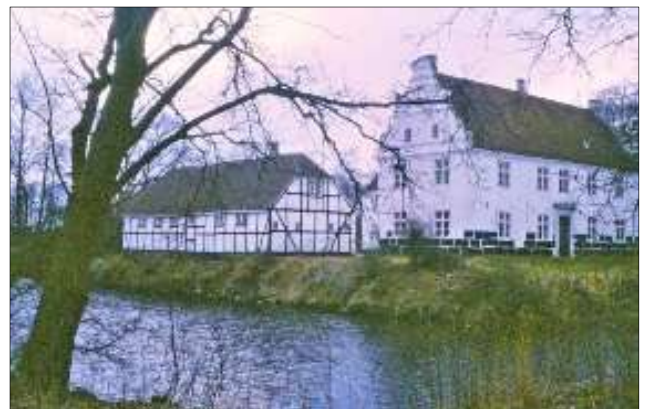
Kørup slot.

Ved Kørup bør vi også se slusemøllen og slusen. I slusen sidder adskillige sten fra Kørup Kirke.