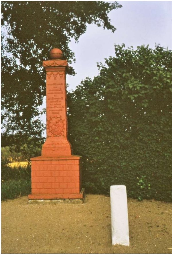
Mindesmærket for de store inddæmninger "Støtten" står i svinget mellem Agernæs og Kørup.