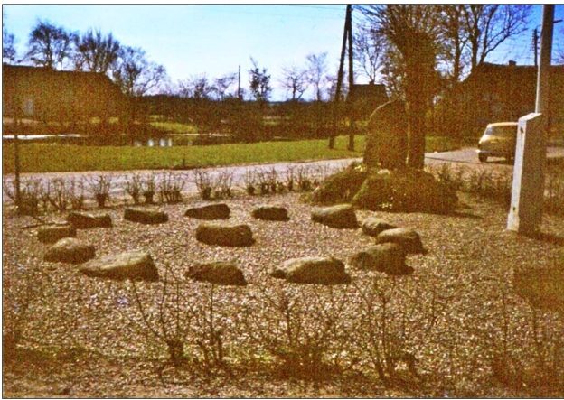
Bystævnet i Tørrø.

Bårdesø er en typisk gammel landsby, der har bevaret sin bystævneplads og noget af det smukke bindingsværk. Byens navn var 1428: Bordhssæ og 1431: Bordese. Forleddet er muligt gammel danske Borth (planke, vort bord). Men det kan også tænkes, at Borth har betydning ”rand”, kant. Ved Bårdesø var tidligere et ret betydeligt teglværk, og ved stranden, Christiansminde, blev der i sin tid (i 1860’erne) af en Odensekøbmand anlagt et handelsetablisement. Her kunne beboerne møde med deres korn og hente varer. Spekulationen mislykkedes ganske vist, men det var en epoke i sognets historie. Mange odenseanere havde adskillige gode ture derud med heste og vogn. Nu er der atter stort besøg af folk fra Fyns hovedstad, og livet pulserer rigt i sommertiden. Men det er ikke fornøjeligere, end da de gamle trådte dansen i det store pakhus.