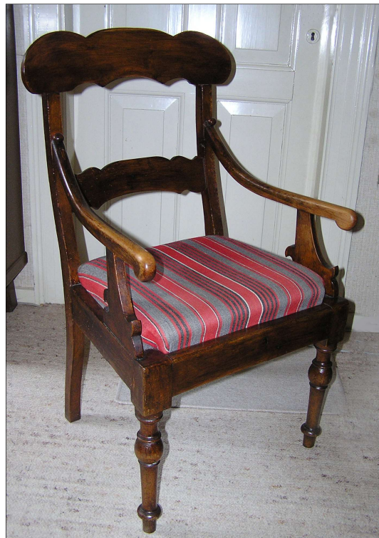
Nordfynsk hjemmævvet dynevår. Her anvendt som stolebetræk.

Langs kysten brændte man tang i massevis for at udlede salt. Det gik godt i lange tider, man satte landbruget i anden række. Et gammelt ord siger: Gud give tang og tørrevejr, hvordan det så går med grøden (det er afgrøden af jord). Sagnet fortæller, at en havfrue forbød denne industri. Sandheden er, der tit var uenighed ved delingen af saltet, og at man omsider indså, det alligevel i det lange løb var bedst at holde sig ved jorden.