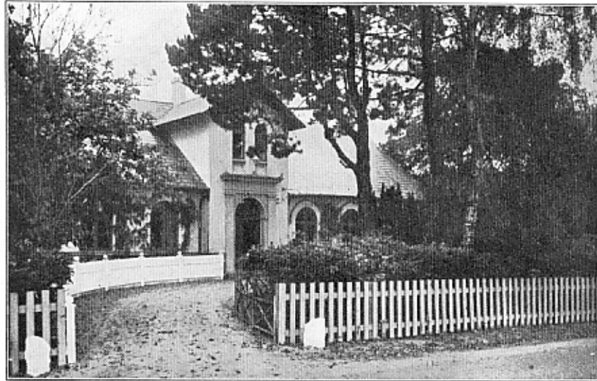
Otterup Apotek. (I. Mohr fot. 1928.)

Steen Steensen Topp fra 1. Maj 1883 til 1. September 1899; senere Apoteker i Farso (III, S. 163—166).